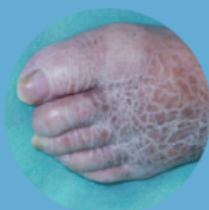
mocznicowa suchość skóry