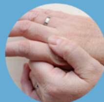
starcza suchość skóry