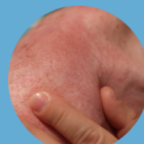
Rumień wywołany radioterapią